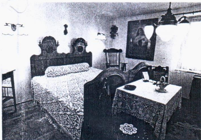
A tisztaszoba ősi magyar tradíciók szerint

lalkozás. A vendégkönyv tanúsága szerint nagy örömet szereztek egyik, hatvanadik születésnapját itt ün-