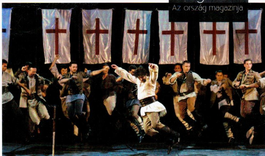
Szegedi Szabadtéri Játékok

Kivételes helyszínen rendezik meg a pusztai különleges előadását. Bugac és környékének hangulata mindenkit megérint, aki egy kicsit is el akar szakadni a nagyvárosok feszültségétől. A pusztai emberek itt mindennapjaikban, eszüközükben, ételükben, dalaikban hűen őrzik a híres – legendákkal átszőtt – betyárvilág emlékeit. A nyugalmas, árasztó táj kellős közepén pedig van egy családi vendéglátóhely, ahol kedves ismerősként fogadják a megfáradt vándort, majd barátként válnak el tőle. A Gedeon tanya ősbemutatója egy legendás szerelmi történetet mesél el, melyből sokat megtudhatunk a vidék múltjáról és jelenéről, megérthetjük, miért váltak a betyárok törvényen kívülivé és hogy mi a csikósok titka. Ló és lovása egymásrautaltságát be is mutatják a „színeszek”, így az előadás ezen része igazi